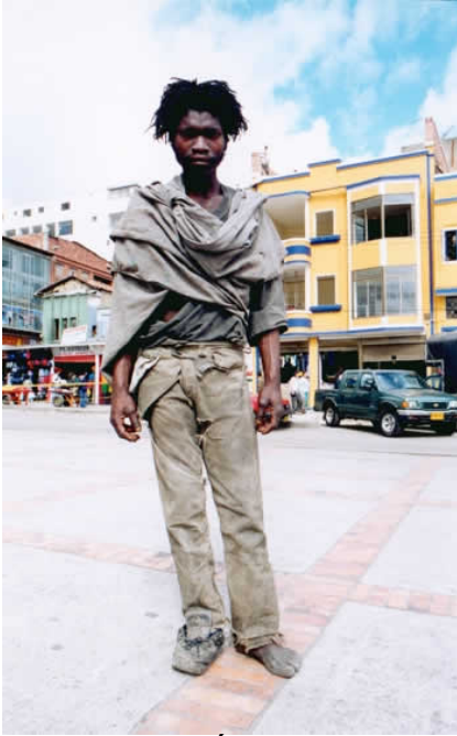
Fig. 5, Jaime Ávila, La vida es una pasarela , 2002 Instalación fotográfica, Dimensiones variables Colección del Artista