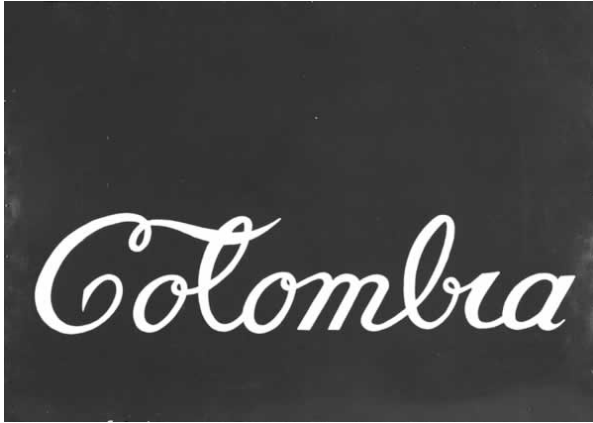
Fig 3 - Antonio Caro, Colombia , 1976–1980 Esmalte sintético sobre lámina de metal 56 x 80 cm Colección del Museo de Arte Moderno de Bogotá