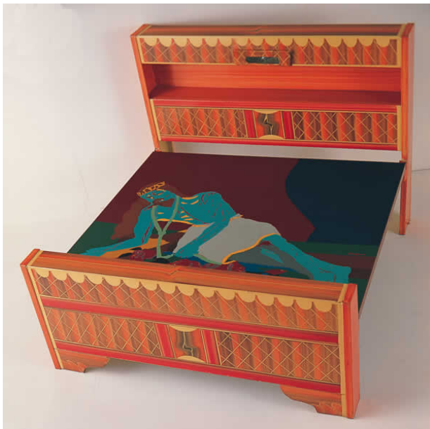
Fig. 4, Beatriz González, Naturaleza casi muerta , 1970 Esmalte sintético sobre lámina de metal ensamblada en mueble 125 x 125 x 95 cm Colección del Museo de Arte Moderno de Bogotá