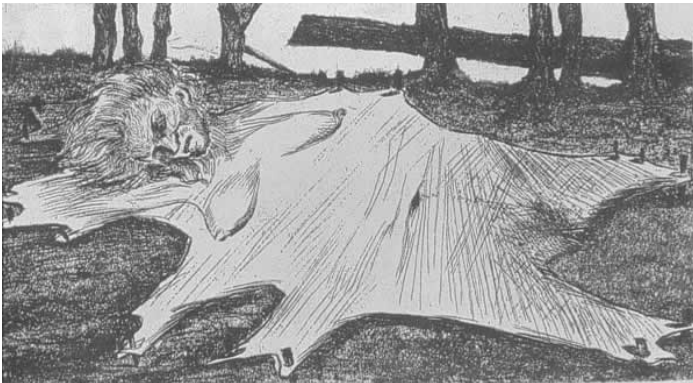
Fig .1 Luis Ángel Rengifo, Piel al sol, de la serie violencia, 1963 Agua fuerte, agua tinta 17/25, 16.8 x 29.3 cm Colección del Museo de Arte Moderno de Bogotá